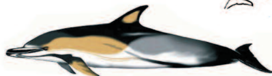
DELFIN COMÚN Delphinus delphis Longitud máxima: 2,20 m.