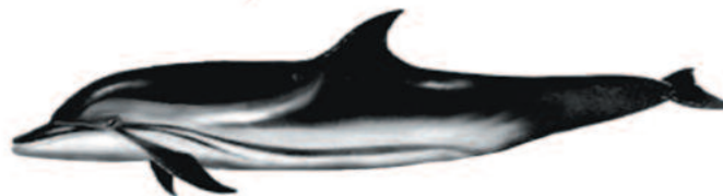
DELFIN RISCADO Stenella coeruleoalba Longitud máxima: 2,20 m.