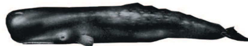
CACHALOTE Physeter macrocephalus Longitud máxima: 18 m.