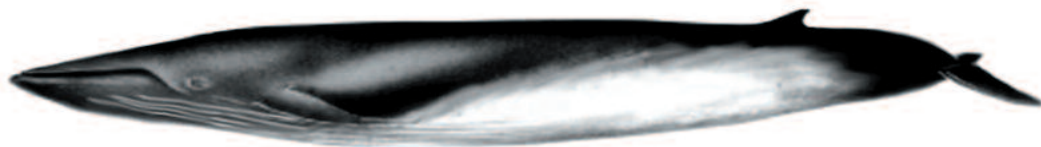
RORCUAL COMÚN Balaenoptera physalus Longitud máxima 23 m.