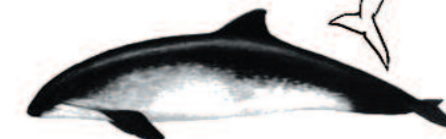
MARSOPA Phocoena phocoena Longitud máxima: 2 m.