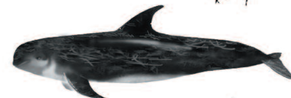
DELFIN GRIS Grampus griseus Longitud máxima: 3,5 m.