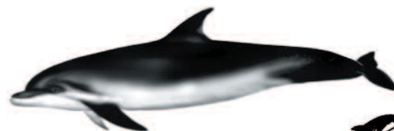
DELFIN MULAR Tursiops truncatus Longitud máxima: 3,5 m.