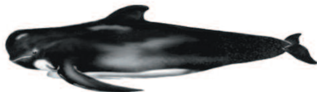
CALDERÓN COMÚN Globicephala melas Longitud máxima: 6,5 m.